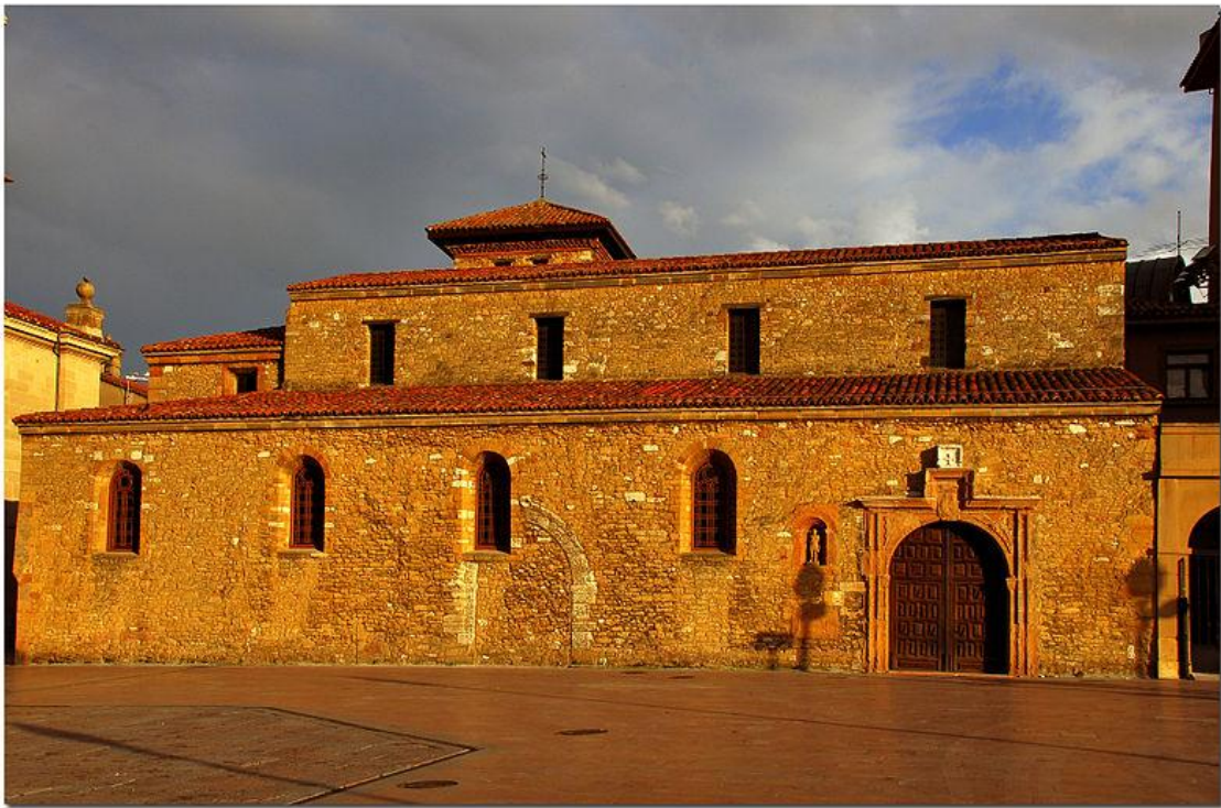
Iglesia de San Tirso el Real, mezcla de prerrománico y románico, en Oviedo (Asturias)