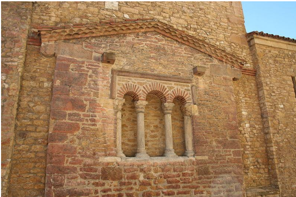
Testero original de la iglesia de San Tirso el Real (Oviedo), templo prerrománico del siglo IX