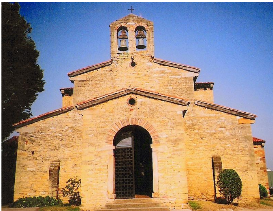
Iglesia de San Julián de los Prados (Santullano, Oviedo)