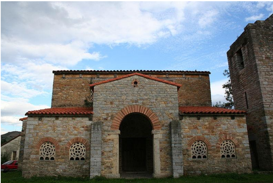
Iglesia de Santa María de Bendones (Oviedo) – entrada