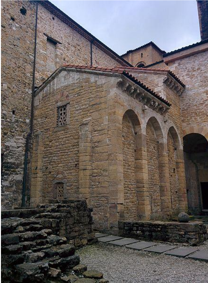
Imagen exterior de la Cámara Santa de la catedral de Oviedo (Asturias) y la cripta de Santa Leocadia.