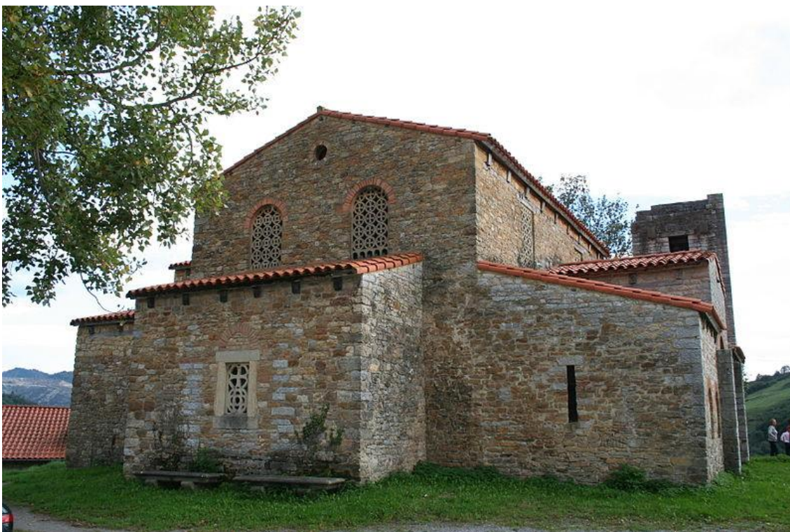
Iglesia de Santa María de Bendones (Oviedo) – vista lateral