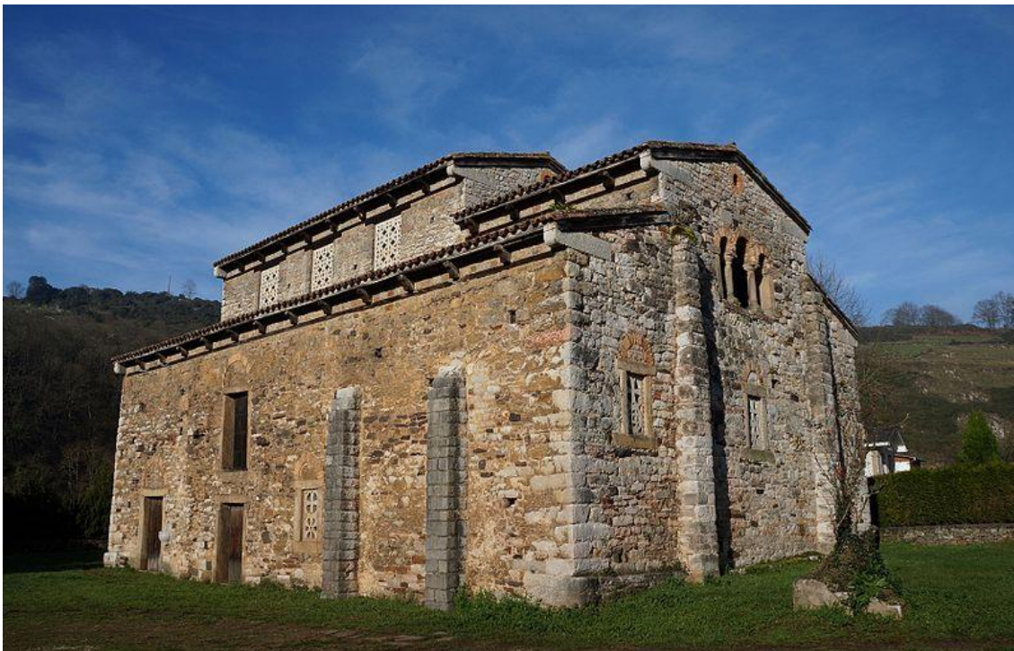
Iglesia de San Pedro de Nora (a trece km de Oviedo)