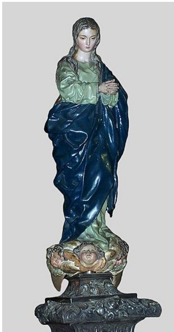
La Inmaculada del facistol (1655), obra escultórica maestra de Alonso Cano Almansa (1601-1667), Catedral de Granada