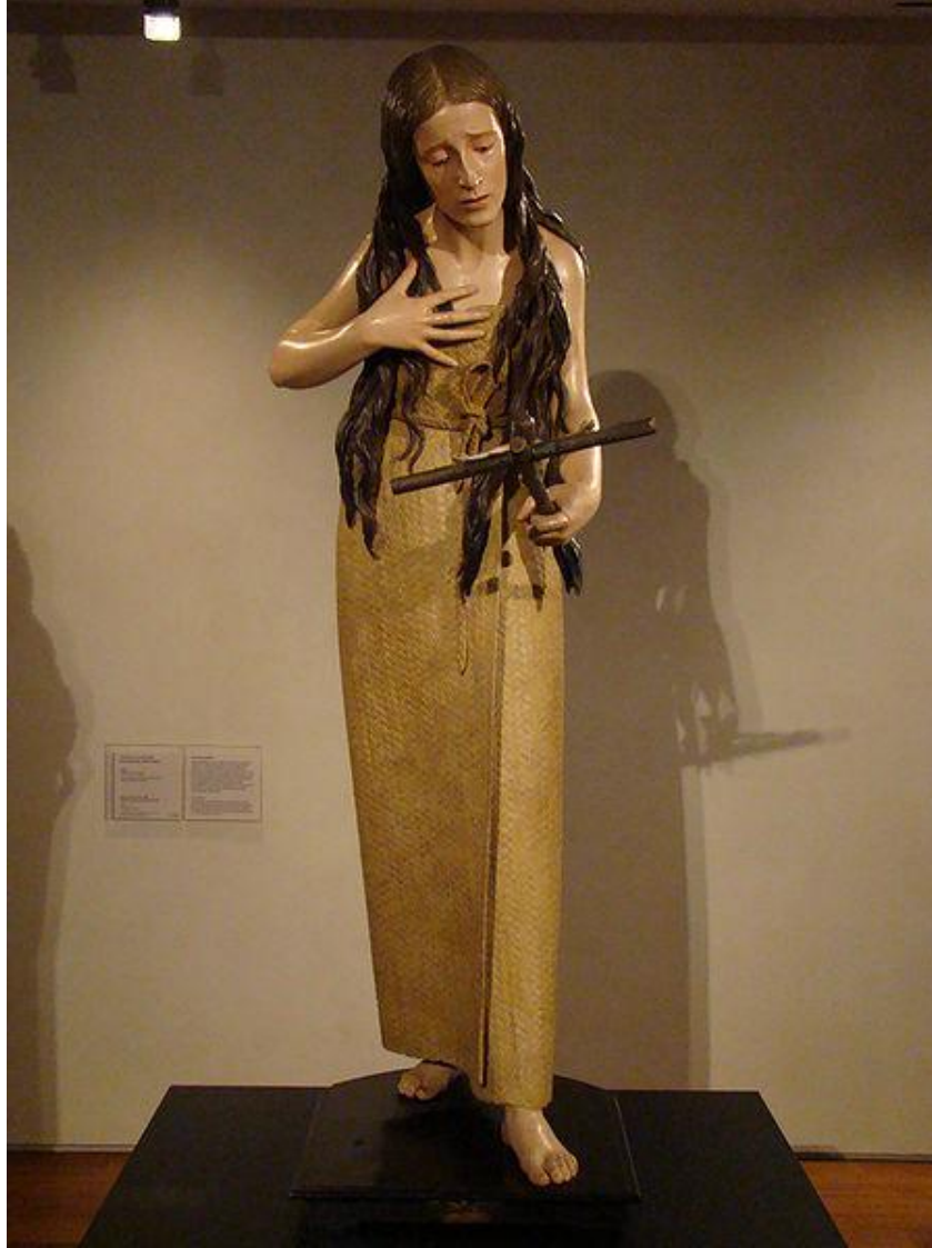
Magdalena penitente , obra de Pedro de Mena