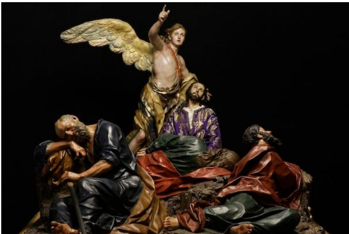
Oración en el Huerto (1752), obra de Francisco Salzillo (1707-1783)