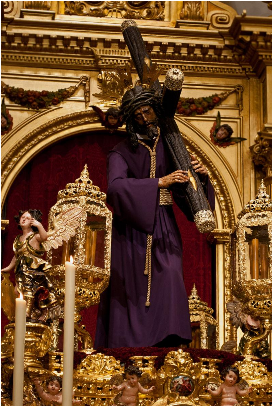
Jesús del Gran Poder (1620), de la iglesia de Jesús, en Sevilla, obra de Juan de Mesa (1583-1627)