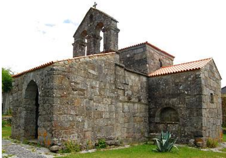
Iglesia de Santa Comba de Bande (provincia de Orense)