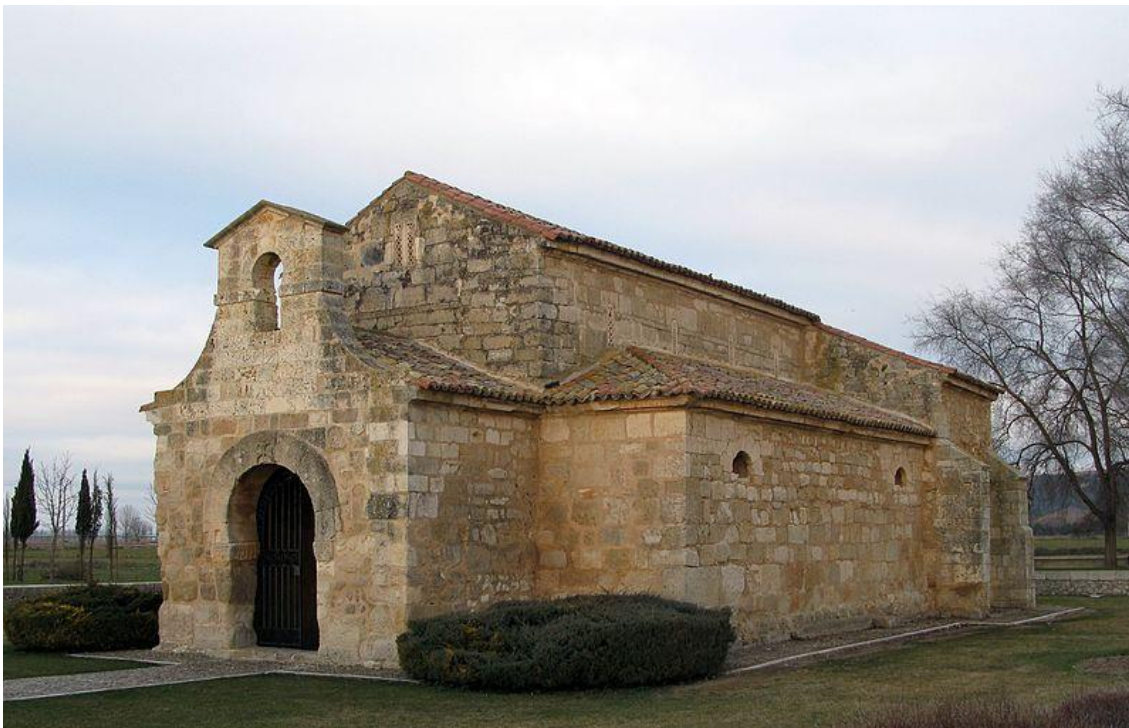
Iglesia visigoda de San Juan de Baños en la localidad de Baños de Cerrato, municipio de Venta de Baños, provincia de Palencia, Comunidad de Castilla y León