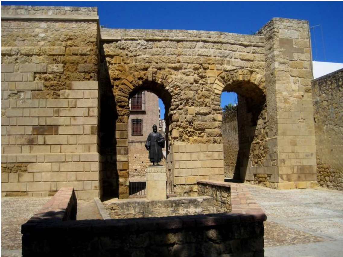
Puerta de Sevilla (Córdoba)