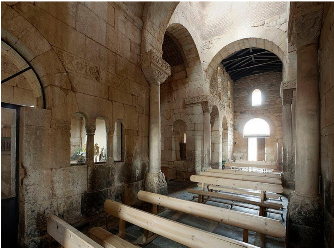
Iglesia de San Pedro de la Nave (El Campillo, término municipal de San Pedro de la Nave-Almendra, provincia de Zamora) – nave central hacia la puerta