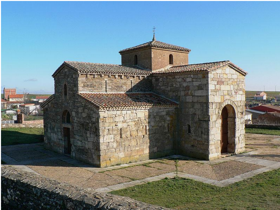
Iglesia de San Pedro de la Nave (El Campillo, término municipal de San Pedro de la Nave-Almendra, provincia de Zamora)