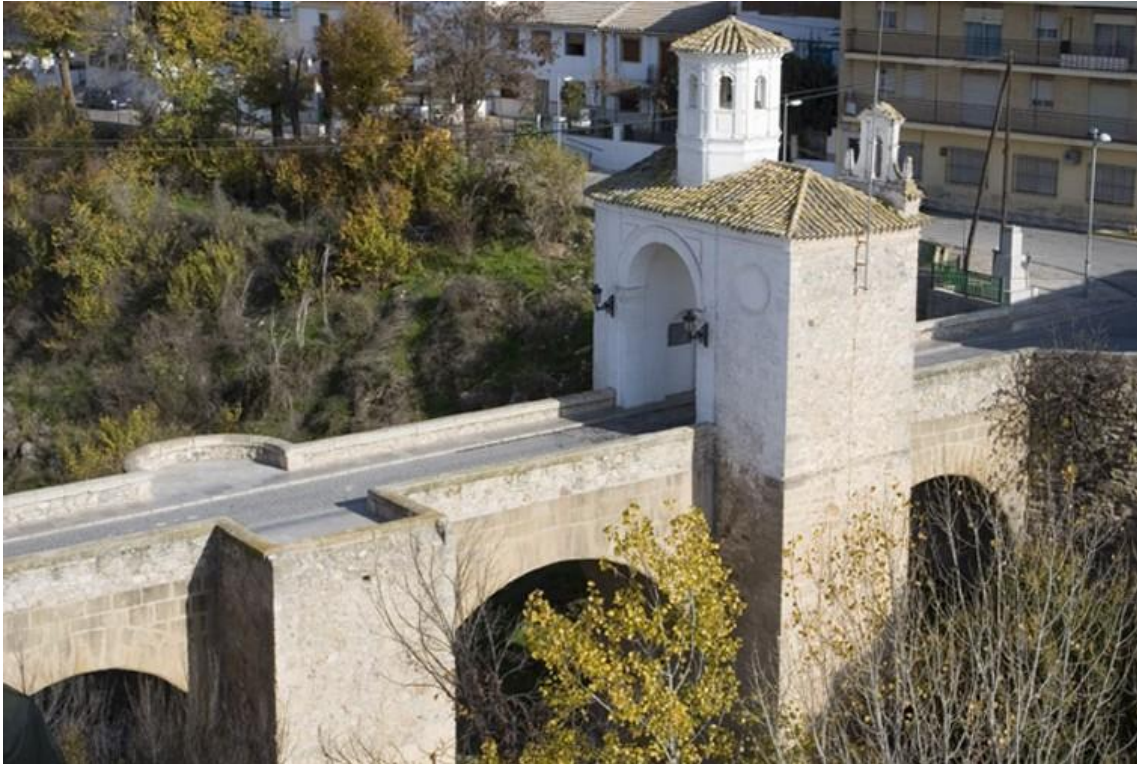
Puente de Pinos Puente (provincia de Granada)