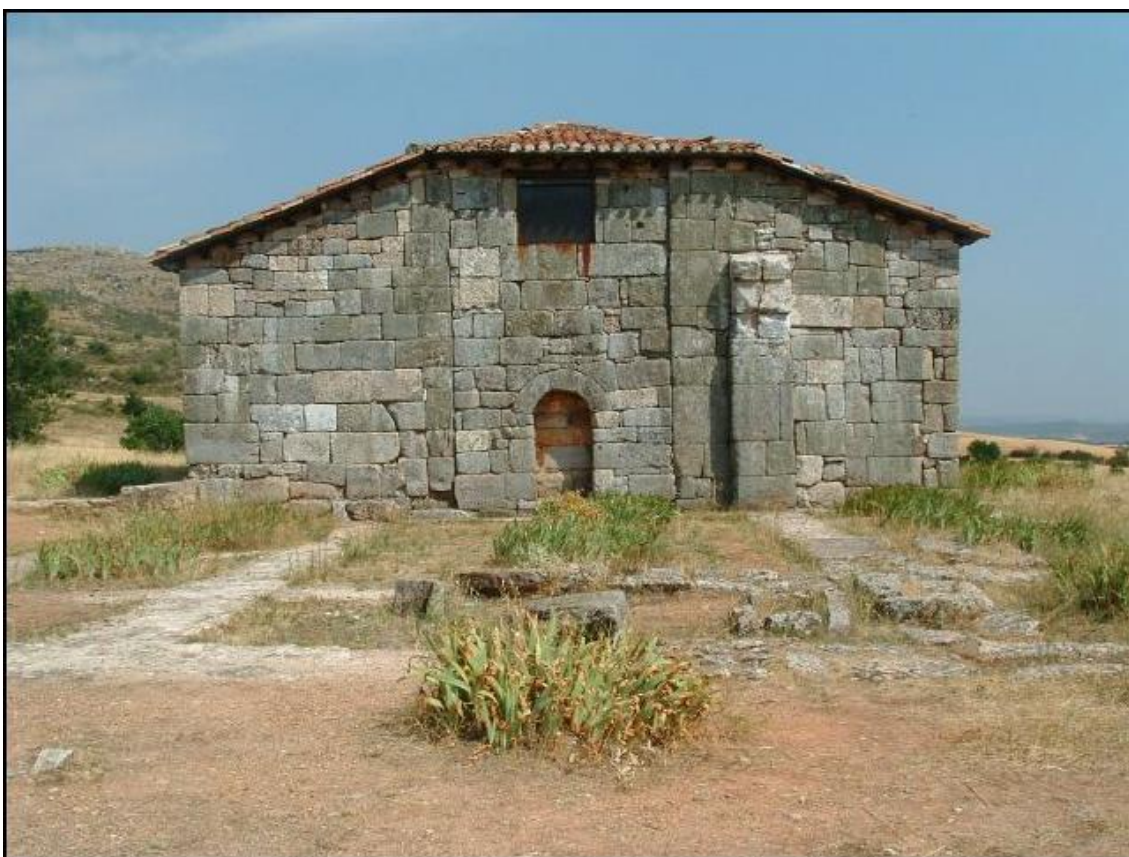
Ermita de Santa María de Quintanilla de las Viñas (en el antiguo alfoz de Lara, provincia de Burgos)