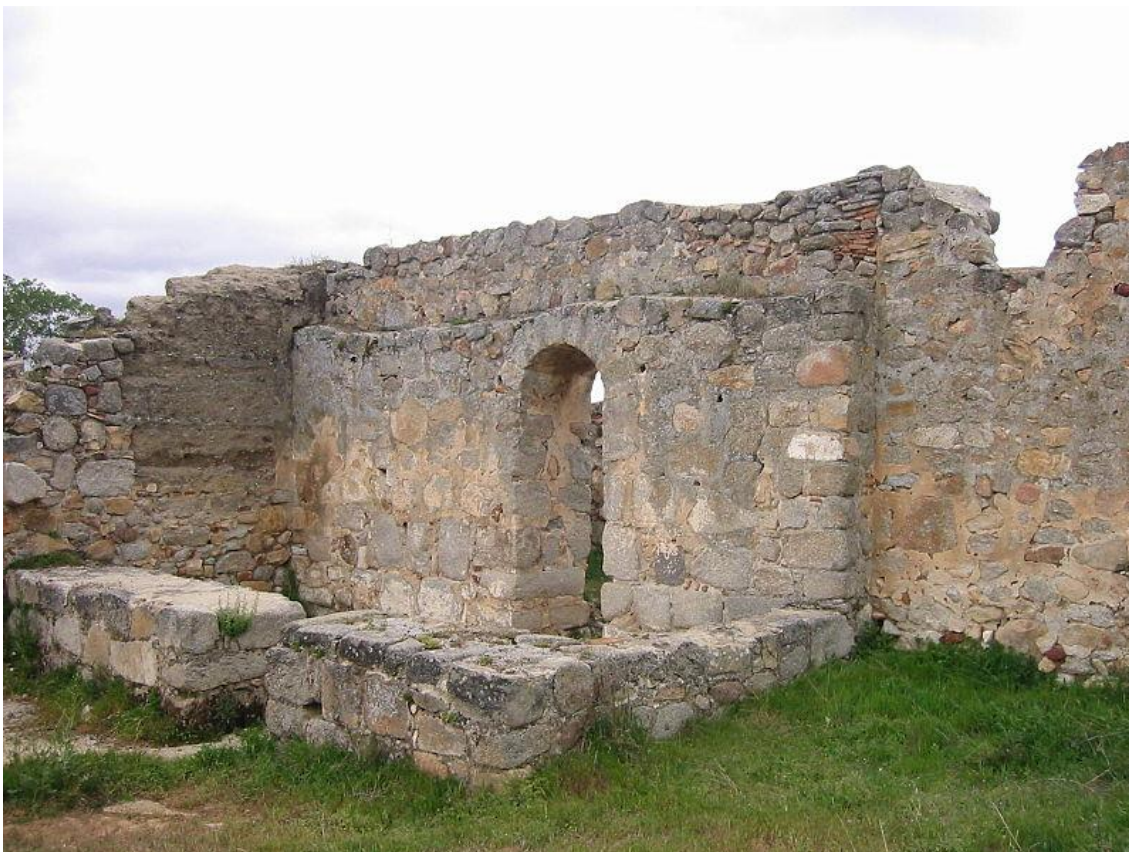
Iglesia de San Pedro de la Mata (Casalgordo, Sonseca, provincia de Toledo)