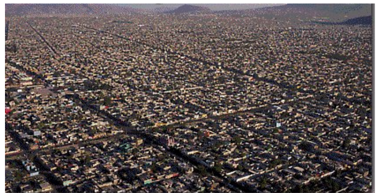
La gran metrópoli Ciudad de México, hoy