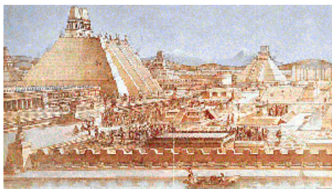
Tenochtitlán, capital del Imperio Azteca (hoy Ciudad de México), antes de la llegada de los españoles.

México es una República Federal dividida en 31 estados y un Distrito Federal donde se sitúa la capital del país, sede del gobierno.